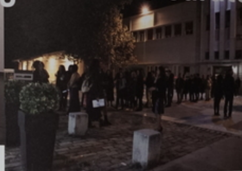
Σταθμότητα των τεχνών της έκθεσης Φωτογραφία Anthony Pomilio.