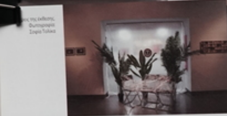
Όψη της έκθεσης Φωτογραφία Luigi Sabba