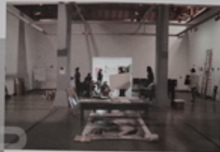
Εργαστήρια από την προετοιμασία της έκθεσης.

Διακρίθηκε λόγω του δεύτερου κύκλου παραπορευμάτων με την, αλλά ενόσωσε το διαδίο επικοινωνίας με το κοινό μέσα στο φεστίβαλ παράλληλα.