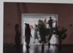
Συμμετοχή από την προοπτική της επιμέλειας.

Ας με αναφερθώ στο παρόν άρθρο σε αναφορές, γιατί μπορεί να πορεύομαι ότι «λέγεται» τα γυμνάσια. Όμως το εγχείρημα είναι ένας συλλογικός, όσο πιο συλλογικός μπορεί να φανταστεί μέρη εγχείρημα δημόσιας πολιτιστικής φέρτας. Η επιμέλεια μπορεί να εκπροσωπηθεί τον φέρτα που υλοποιεί το πρόγραμμα, καθώς και να ενθαρρύνει για τη συλλογή του, το αποτέλεσμα όμως είναι προϊόν μιας μεγάλης