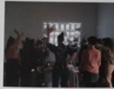
Εργαστήρια από την προετοιμασία της έκθεσης.